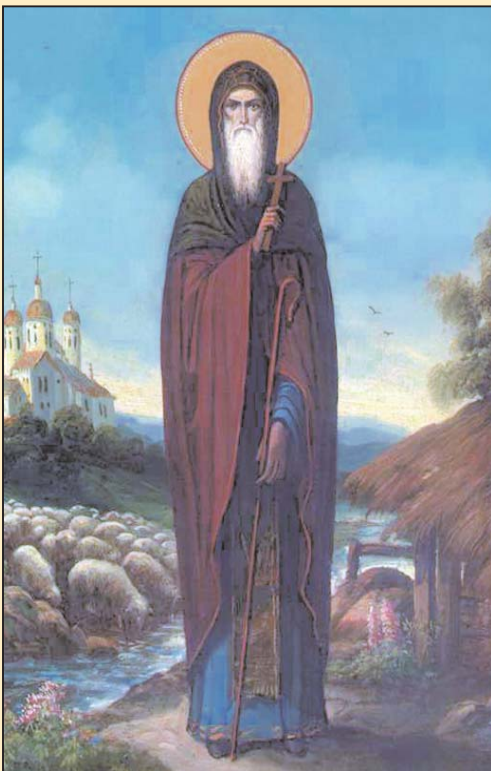
plini de respect și evlavie, chiar dacă nu sunt ortodocși ca noi. Se vede că sfinții și evlavia n-au graniță!

Măare mi-a fost bucuria să aud la Iași, cum o Cucuocană din Norvegia vine de 7 ani la hramul Cuvioasei Parascheva cu un grup de doamne și domni